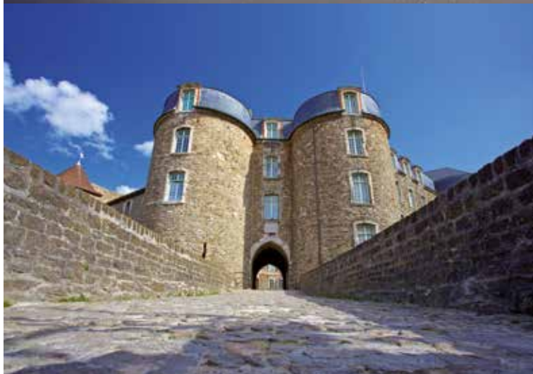
De omwallingen van Boulogne-sur-Mer